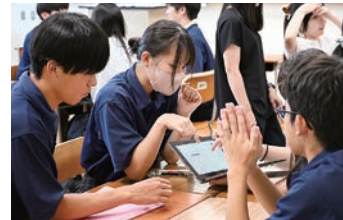
課題研究グループワーク