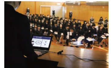
ライフプラン発表会