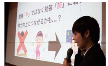
課題研究全体発表会